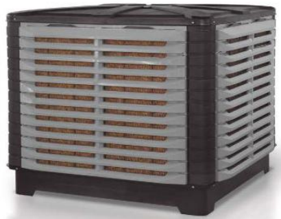
Figura 2 – Exemplo ilustrativo de climatizador evaporativo e acessório (teto).