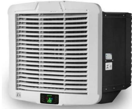
Figura 3 – Exemplo ilustrativo de climatizador evaporativo (parede).